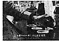
吃醬油皮膚會變黑？